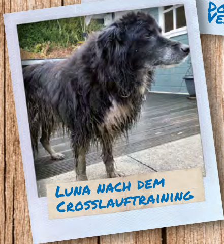
LUNA NACH DEM CROSSLAUFTRAINING