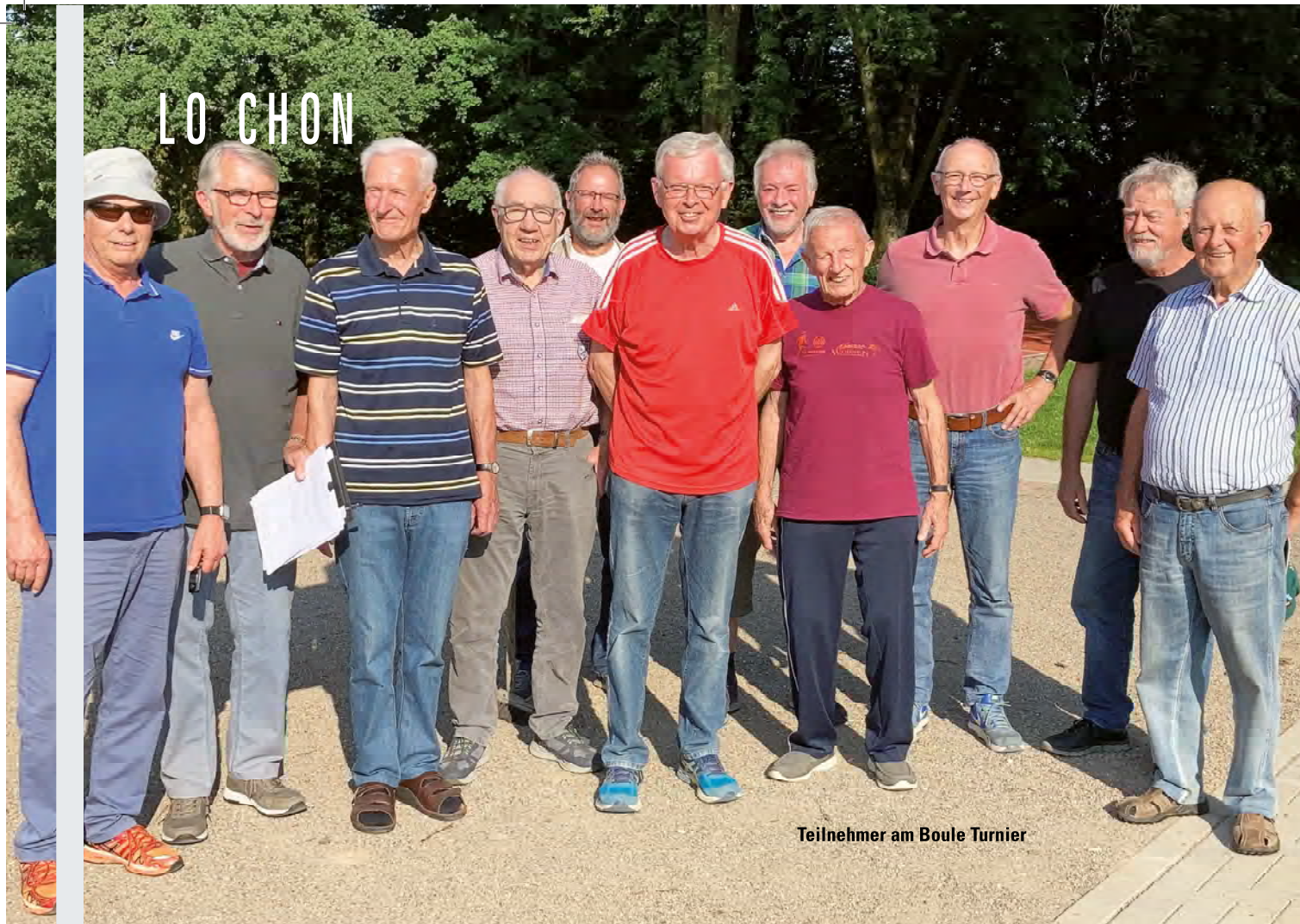
Teilnehmer am Boule Turnier