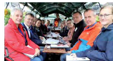
Bewertungskommission des Märkischen Kreises per Planwagen auf Besichtigungstour durch's Dorf

Und für unseren TUS gilt: Lläuft es im Dorf, dann fluppt es auch im Verein. Wenn wir z.B. die Infrastruktur weiter verbessern und die Lebensqualität (auch im Bereich der Nachhaltigkeit und des lebendigen Miteinander erhöhen) wird dies zwangsläufig dazu führen, dass sich die Menschen hier wohl fühlen und auch mit Freude zu unseren Trainings kommen und an unseren Veranstaltungen teilnehmen.