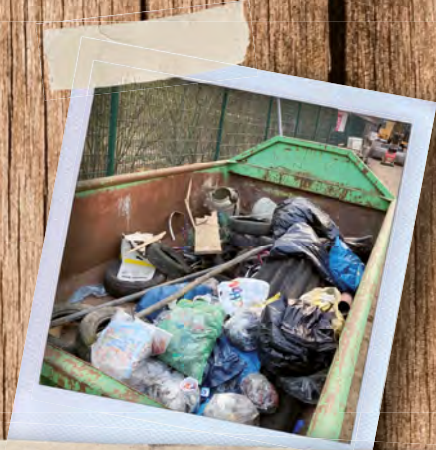
SAUBERES HALVER – CORONA EDITION 2. AUFLAGE: DAS TEAM PETRA BUCH (MIT GESAMMELTEM MULL) UND SABINE SCHWARZER (AN DER KAMERA)